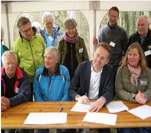
NLdoet : Ondertekening samenwerkingsovereenkomst

Het is gebruikelijk geworden dat de Stichting Vrienden mee doet aan de jaarlijkse NLdoet dag en de jaarlijkse Natuurwerkdag. In 2018 zijn deze geslaagd verlopen. Bij de NLdoet-dag in maart 2018 waren ruim 30 personen aanwezig en bij de Natuurwerkdag in november 2018 ongeveer 25 personen. De accenten bij deze dagen ligt op het inzetten van groepen en individuele personen bij het onderhoud en beheer van de Natuurtuin. De Stichting Vrienden is zeer erkentelijk voor de inzet van zoveel vrijwilligers bij het beheer en onderhoud in de Natuurtuin.