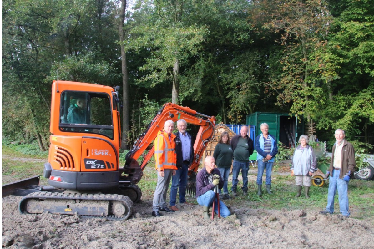
Vrijwilligers samen met aannemers bij het bewerken van de grond van de insectenveld.