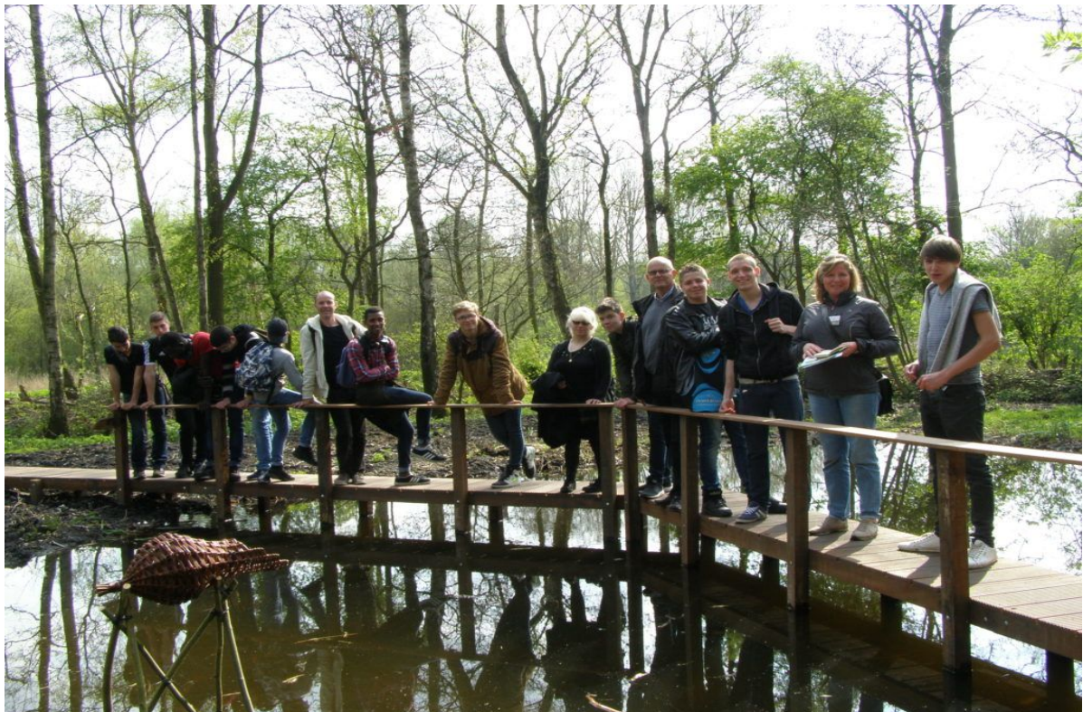
Een rondleiding van Franse scholieren bij de open veenplas met nieuw vlonderpad.

De rondleidingen worden breed gecommuniceerd in de lokale media, facebook en de website van de Stichting Vrienden.